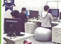
事業所部門準グランプリ 株式会社 マグナデザインネット