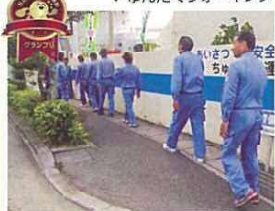
事業所部門 グランプリ 株式会社 八電工