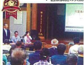
地域活動部門 グランプリ 竹富診療所・竹富公民館