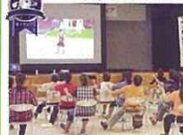
地域活動部門準グランプリ 名桜大学ヘルスサポート