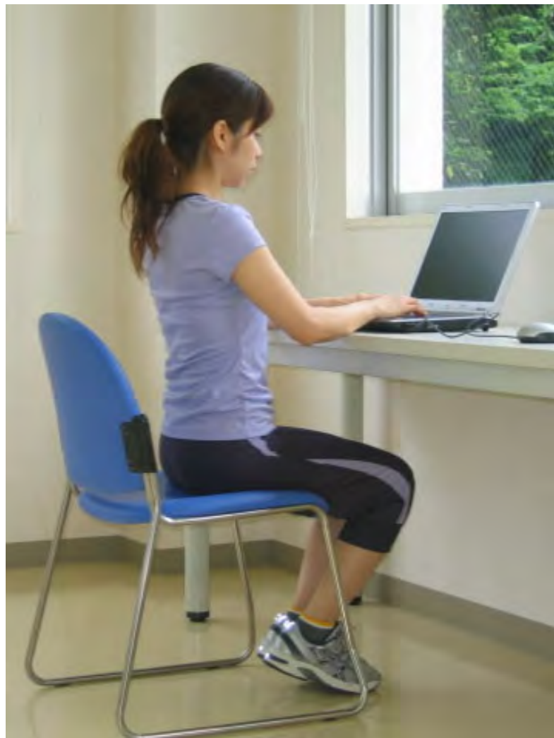
デスクワークの姿勢 (集中できないときには呼吸法を)